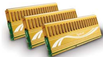
Giant II Memory Series

Наши партнеры: www.ak-cent.ru www.tl-c.ru www.smartdisc.ru www.video-audio.ru www.inzer-tech.com