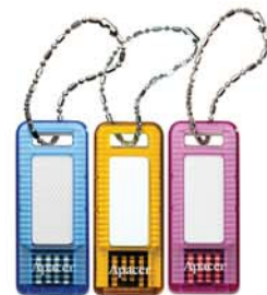
HANDY GENO USB Stick AH162