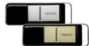
HANDY GENO USB Stick AH521 & AH522