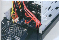
Skopovje: Uz prostor za čak 4 tvrda diska spojenu u RAID-u, lažice se i povećani ventilator.

Tvrtke srednjih veličina ratuju s novijim pojmovima. Gigabajti više nisu in , sada nam trebaju terabajti, a to je vrlo skupo, pogotovo ako vam trebaju uglavnom samo za storage . Jasno, tržište se polako priprema za eksploziju novih uređaja koji mogu ispuniti takve zahtjeve. Oдавno poznato rješenje, NAS (eng. Network-Attached Storage ) je koncipirano kao "mrežni disk". U principu, to je vanjski disk s mrežnim priključkom i nekim balansiranim sučeljem za par osnovnih postavki. Da? Ne! To je prošlost. Na tržištu se pojavljuju sve "pametnije kutije", a predstavit ćemo vam ukratko jednu koja je došla iz