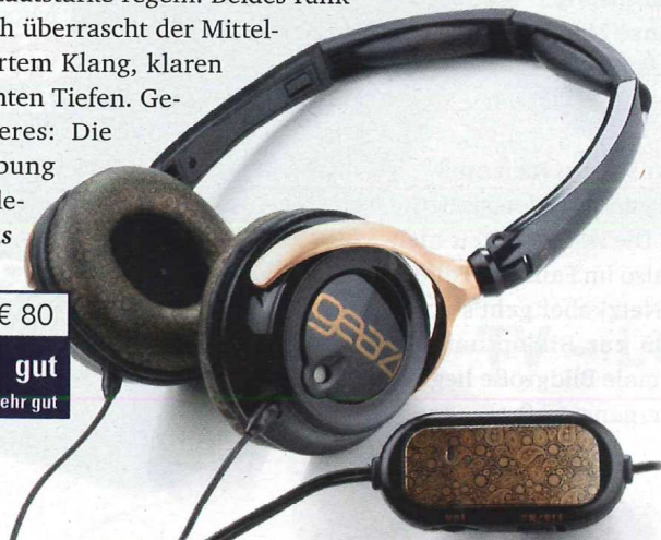
Gear4 GP01nc € 80 video gut HOME VISION Preis/Leistung: sehr gut

Der Gear4 GP01nc rühmt sich einer aktiven Geräuschkürzung (Noise Cancelling), die über die am Kabel angebrachte Fernbedienung gesteuert wird. Dort lässt sich auch die Lautstärke regeln. Beides funktioniert tadellos. Auch klanglich überrascht der Mittelklasse-On-Ear: mit differenziertem Klang, klaren Höhen und moderat abgestimmten Tiefen. Geschmackssache ist sein Äußeres: Die herbstlich-goldbraune Farbgebung muss man mögen. Gut für modebewusste Sparfüchse. as