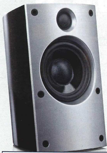
Teufel Concept B 20 € 100 video gut HOME VISION Preis/Leistung: sehr gut