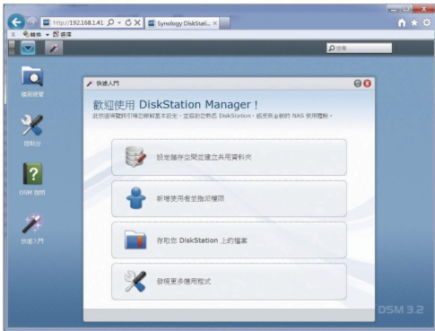
▲圖形化設計的DSM操作介面，讓初學者也能快速上手