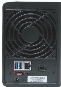
▲機身背後具備兩個USB 3.0連接埠以及Gigabit LAN網路孔

Synology DS212+網路磁碟機支援高速Gigabit網路與高效能硬體，搭配類似Windows系統的圖形化操控介面，操控簡單好上手，PCDIY!在此特別推薦。