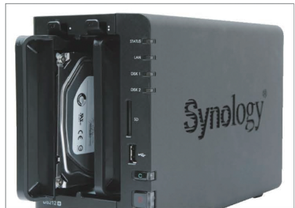
▲將前方面板卸下後即可安裝兩顆2.5吋或3.5吋硬碟