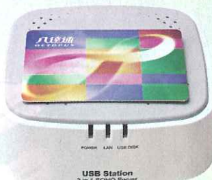
體積細小，方便擺放。