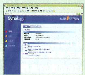
介面易用，但功能上只能滿足一般用家要求。