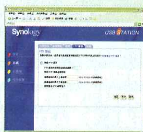
FTP設定方面亦十分簡單，還可限制上下載速度。