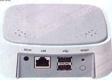
提供2 Port USB支援，除了USB硬碟外還可接駁印表機及USB Flash Drive。